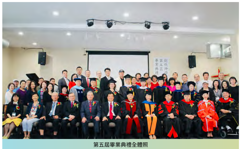
第五屆畢業典禮全體照